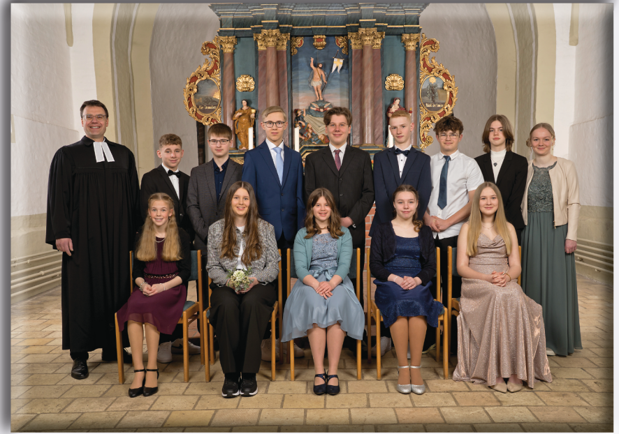
Sonntag, 19. April 2026, 10 Uhr