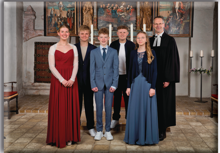
Sonntag, 26. April 2026, 10 Uhr

gemeinsam mit den Konfirmanden der Gemeinde Bargum