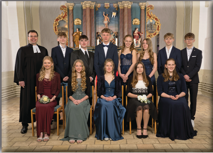
Samstag, 18. April 2026, 14.30 Uhr