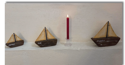
Dieses Foto zeigt die drei Holzschiffe in der Kirche in lisaku, die wir 2012 zum 20jährigen Jubiläum der Partnerschaft geschenkt haben. Es sind „Glaube, Liebe und Hoffnung“, „Lootus, Usk und Armastus“. Sie stehen seitdem in der Kirche