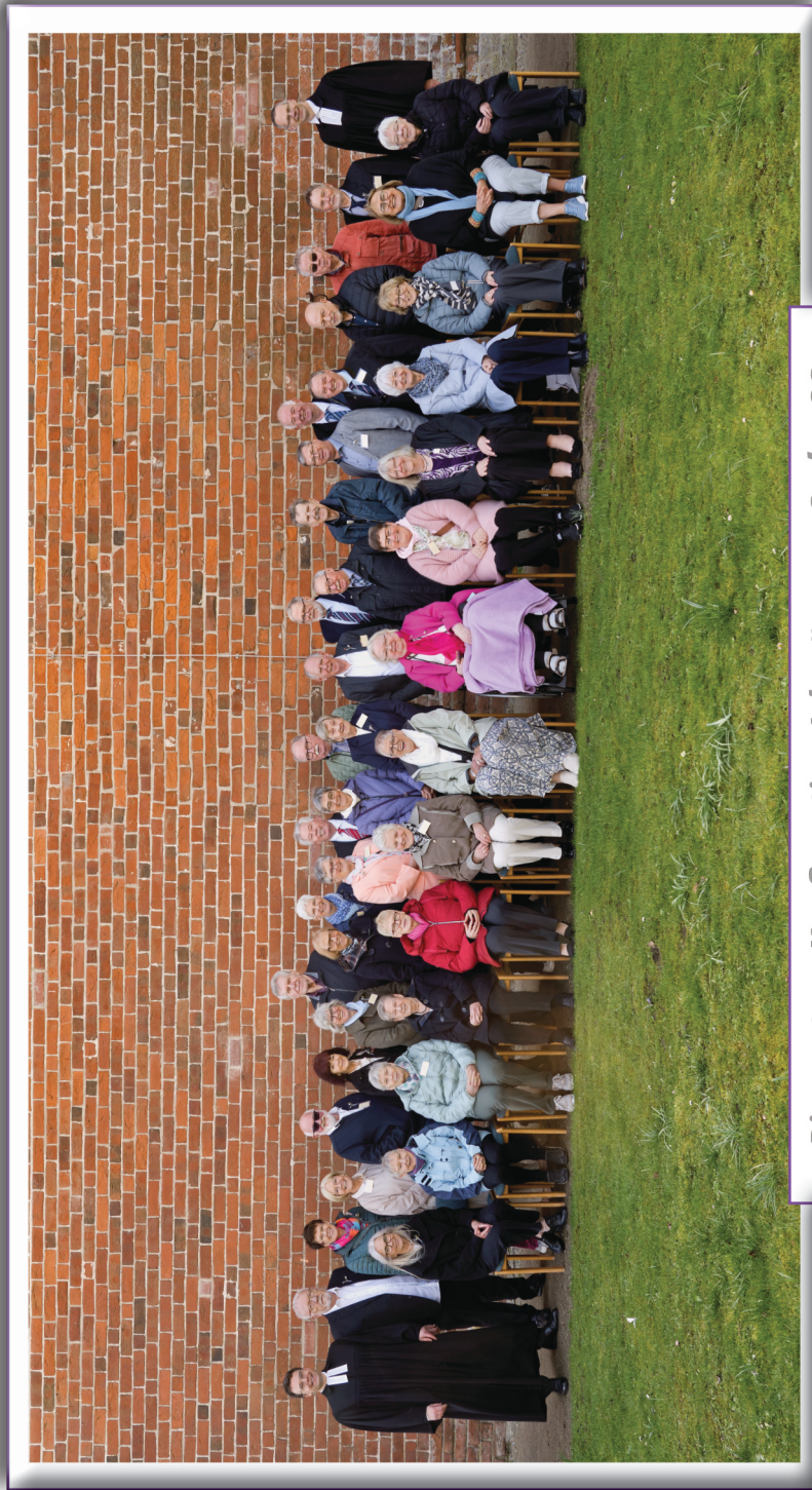
Diamantene Konfirmation Jahrgänge 1965/1966

AUS DATENSCHUTZGRÜNDEN KEINE VERÖFFENTLICHUNG IM INTERNET!